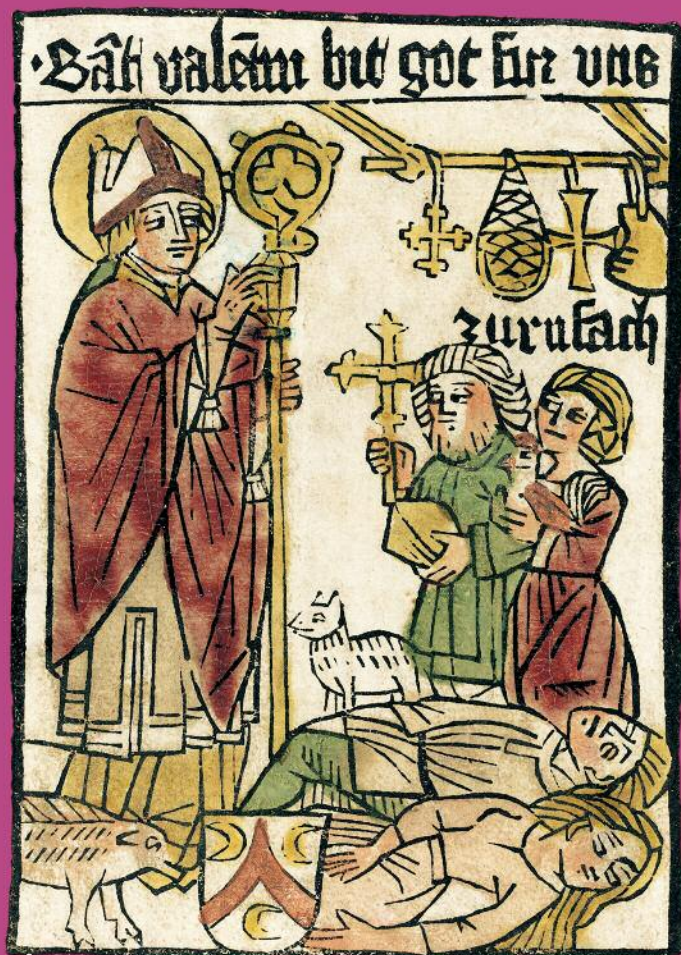
2 Svätý Valentín z Raetie na kolorovanej pútovej tlači z 15. storočia. Dve ležiace osoby postihnuté epilepsiou svätec lieči a kľačiaceho muža a ženu pred touto chorobou chráni zehnjúcim gestom.