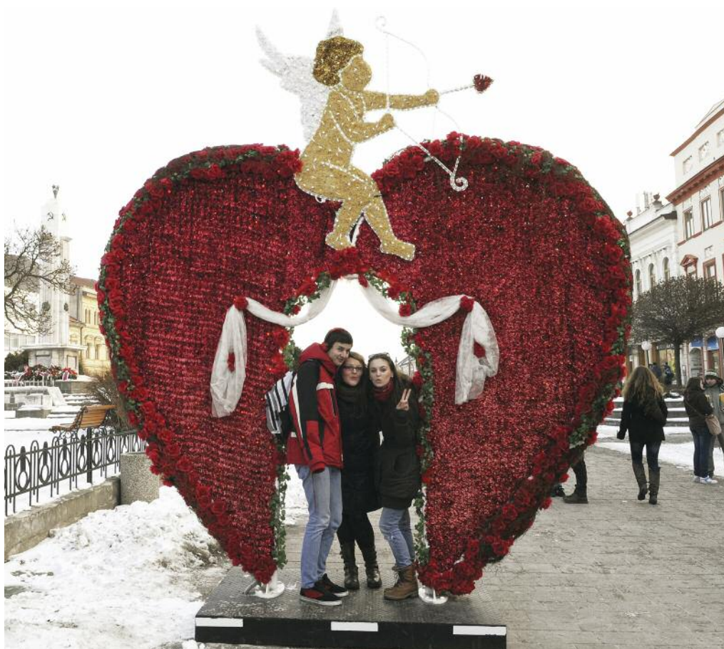
469 Prešov 2011 [online]. 470 Valentín omámil 2011 [online].

24 V roku 2008 sa v Prešove stalo súčasťou osláv Valentína srdce s postavou kupida. Ako kulisa vyhľadávaná na fotografovanie nielen pármí zaľúbencov, ale všetkými obyvateľmi mesta, sa dodnes vždy v polovici februára objavuje na najväčšom prešovskom námestí.