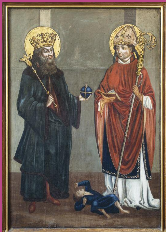
3 Svätý Štefan Uhorský, kráľ (vľavo) a sv. Valentín. Pri jeho nohách leží chlapec, ktorého telo je skrivené chorobou. Tabuľová maľba na krídle neskorogotického oltára z rokov 1500 - 1550 v Kostole Mučeníckej smrti sv. Jána Krstiteľa v Sabinove.